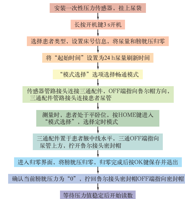
图 4 膀胱压力监测流程

【背景与证据】 肠道对 IAP 最敏感, IAP 常反映患者的肠道功能; IAH 使肠管及肠壁血管受压, 可使肠壁缺血、肠蠕动减弱或消失 [127] 。腹内高压和腹腔间室综合征国际专家会议认为, 腹部有病理症状、低灌注或液体过多的患者有发生 IAH 的危险 [79]