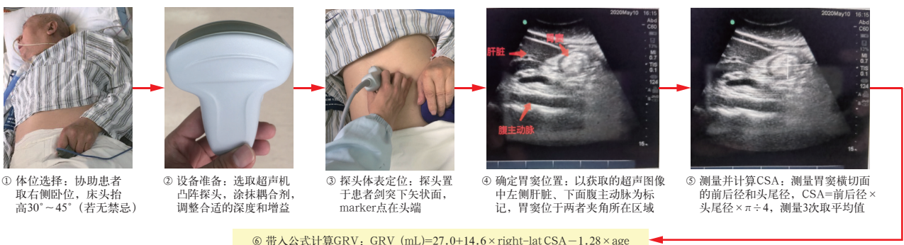
图 3 床旁超声法监测 GRV 流程

【背景与证据】 高水平 GRV 是胃动力下降的重要表现,在预防或治疗危重患者胃动力低下的策略中,促动力疗法是有效的,通常使用促胃动力药物。促动力药物包括多巴胺受体拮抗剂(甲氧氯普胺、多潘立酮)、运动激动剂(红霉素)、血清素-3 与血清素-4 受体激动剂的混合物(西沙必利),其中红霉素通过鼻饲或者静脉注射方式可以有效改善动力问题 [91] (证据级别: Level 4b)。ESPEN 指南纳入 6 项 RCT 研究探讨促胃动力药物的效果,结果显示,经胃喂养不耐受的危重患者,应优先考虑静脉注射红霉素,通常剂量为 100~250 mg,每日 3 次,持续 2~4 d;若使用甲氧氯普胺,通常剂量为 10 mg,每日 2~3 次 [2] (证据级别: Level 1a)。Lewis 等 [97] 的研究显示,静